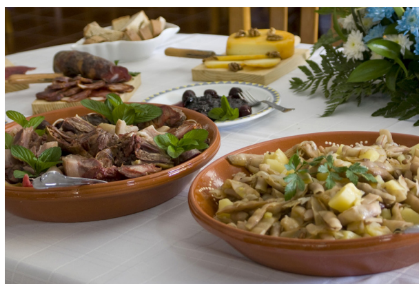
Casulas com butelo